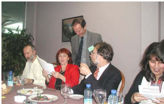
Munkavacsora a javából. A képen: az EuroGeographics, a Szófiai Műegyetem, az EUROGI, az URSIT és az Isztambuli Műegyetem képviselői lázas egyeztetésben.

Sikeres térinformatikai alkalmazások bemutatása Harghita megyéből (Románia).