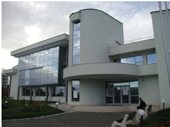
A SEE-SDI-2003 konferencia színhelye

A konferenciát nagy érdeklődéssel kísért kiállítás tette még hasznosabbá. A kiállítók egy része partnerként magyar térinformatikai cégeket, intézményeket is meg tudott nevezni.