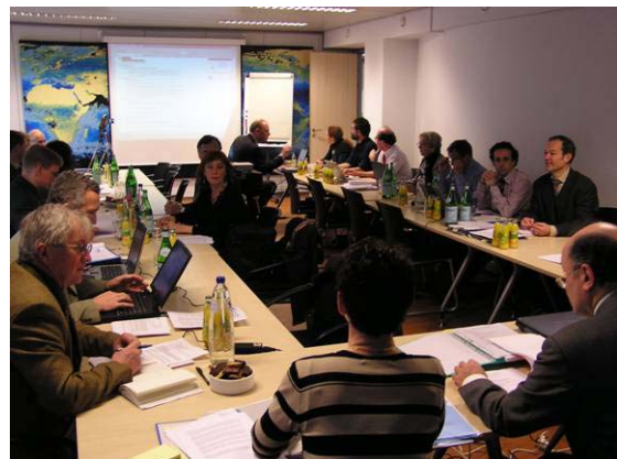
Munkában az EUROGI közgyűlése

A közgyűlésen ismertették az Osztravai Egyetemen kötött megállapodás alapján a Webcastle szolgáltatás beindítását, amelynek célja az európai sikeres térinformatikai alkalmazások Internet alapú bemutatásának biztosítása, az esetek számának jelentős gyarapításával. Magyarország a bemutatott esetek számát tekintve a mezőnyben jól áll, csak Franciaország előzi meg, de a pozíció megőrzése a HUNAGI tagszervezeteinek aktív közreműködését igényli a jövőben is. Bővebb információ a hunagi@axelero.hu – n kérhető.