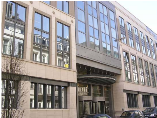
Az EU Kutatási Főigazgatóságának Joseph II utcai épülete, mely éppen idegenforgalmi és kulturális jellegű Magyarország kiállításnak adott helyt.