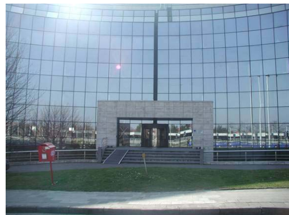
Az EU Információs Társadalom Főigazgatóságának székhelye, a magyar szakmai kiállítás és ünnepi rendezvény színhelye